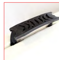
Maniglia per il trasporto