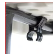
Impugnatura in plastica per una facile chiusura