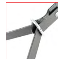
I piedi sono bloccati da anelli in metallo