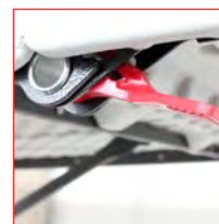
Sistema bloccante di sicurezza sotto il piano del tavolo